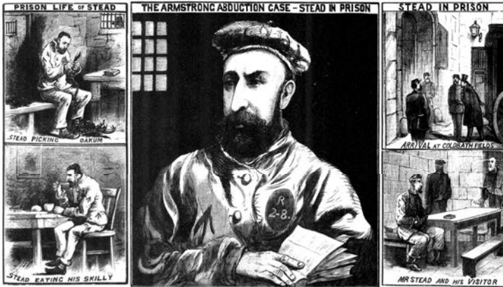
Illustrated Police News , 21. listopad 1885.

s Elizou v pokoji, než se probrala, a když ho spatřila, začala prý ječet. Potom odešel a Rebecca odvezla Elizu do Paříže, kde se o ni starala, dokud se nezklidnilo pobouření vyvolané sérií Steadových článků.