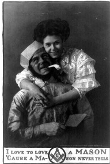
Knihovna Kongresu, počátek 20. století.

Lidé žijící ve viktoriánské době vyznávali názor, že při sexu mají být uspokojeni oba, nicméně tato představa platila hlavně v rámci manželského života. Na sex mimo manželství pohlížel tisk a stejně tak i veřejnost se značným opovržením, ale manželský sex hrál významnou roli. Hledání toho pravého člověka, jenž by se k vám hodil po fyzické stránce a s nímž byste mohli strávit zbytek života, se řídí-