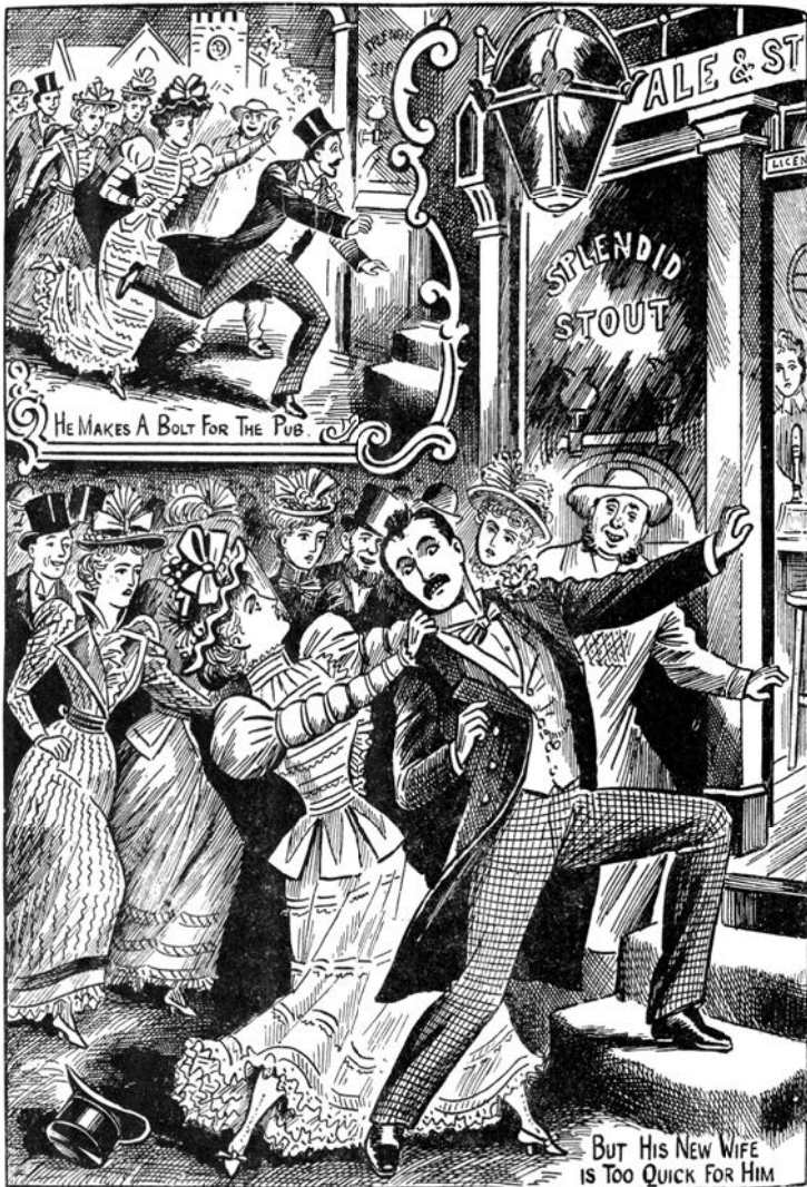
THE BRIDEGROOM WANTED A DRINK, BUT THE BRIDE HAD HER WAY.

Illustrated Police News , 18. září 1897. Image © THE BRITISH LIBRARY BOARD. ALL RIGHTS RESERVED. Otištěno s laskavým svolením The British Newspaper Archive ( www.britishnewspaperarchive.co.uk ).